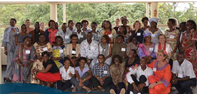
LES PARTICIPANTS, INCLUANT QUELQUES CHARGÉS DE COURS DE LA CARLETON UNIVERSITY ET DE L'UNIVERSITÉ DE LA SIERRA LEONE, LORS D'UN ATELIER AXÉ SUR LA VIOLENCE SEXUELLE TENU À BUJUMBURA, AU BURUNDI, EN FÉVRIER 2013.

University et à l'Institut Nord-Sud. Pendant leur visite, les chargés de cours ayant participé à l'initiative ont eu l'occasion de discuter des secteurs de collaboration possible, de convenir des secteurs prioritaires pour l'enseignement, d'établir une compréhension commune des objectifs à atteindre dans le cadre du cours et de commencer à cerner les premières étapes.